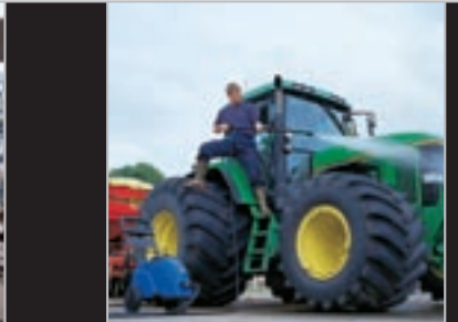
Pour un nettoyage rapide et efficace